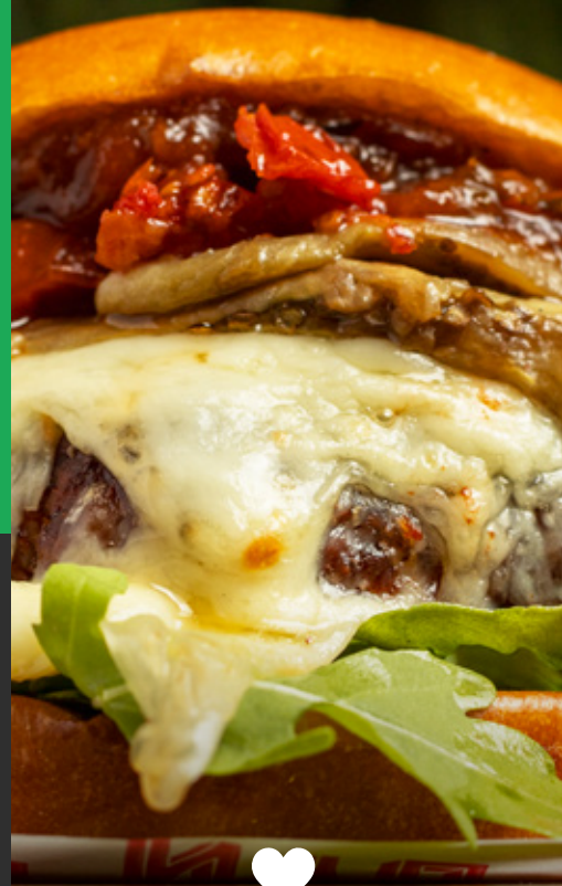
· TOP SELLER · VEGGIE LITTLE ITALY