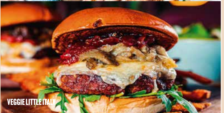
VEGGIE LITTLE ITALY