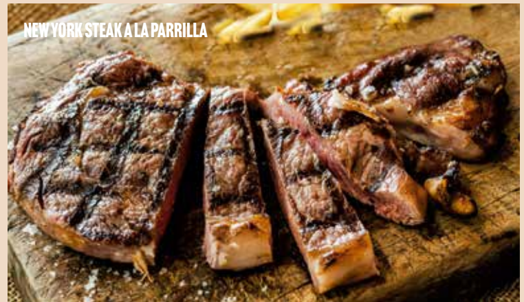
NEW YORK STEAK A LA PARRILLA

Jugosa y tierna costilla de vaca, se deshace en la boca. Ahumada durante 8 horas, la glaseamos sobre la parrilla con la salsa que más te guste: Salsa miel mostaza o BBQ.