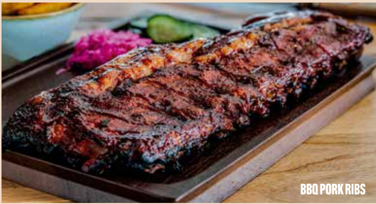
BBQ PORK RIBS

Todas nuestras carnes ahumadas van acompañadas de patatas fritas o en gajo o ensalada de col. PUEDES CAMBIAR TU GUARNICIÓN POR ALGUNA DE LAS OTRAS POR UN EXTRA ADICIONAL.